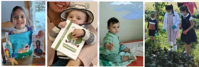
*Centre de Ressources et de Compétences de la Mucoviscidose