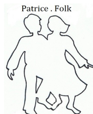
Danse d'ici et d'ailleurs